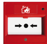
Figuur 1: handbrandmelder