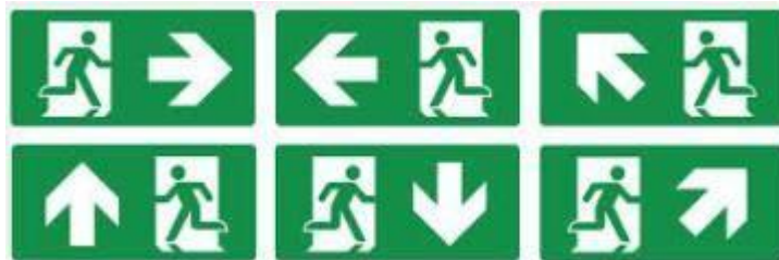
Figuur 4 - Vluchtwegbewijzing