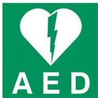
Figuur 2 - AED symbool

Op diverse centrale plekken in de Jaarbeurs gebouwen hangt een AED, te herkennen aan onderstaand symbool.